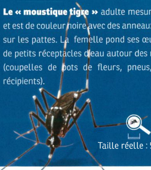
Taille réelle : 5mm

Le « moustique tigre » adulte mesure 5 mm et est de couleur noire avec des anneaux blancs sur les pattes. La femelle pond ses œufs dans de petits réceptacles d'eau autour des maisons (coupelles de pots de fleurs, pneus, autres récipients).